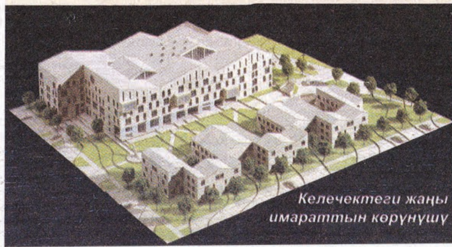
Келечектеги жаңы имараттын көрүнүшү

Жаңы кампуста жаңы технология колдонулуп жатат. Эң кызык жери окуу жайга геотермалдык энергия колдонулуп жатабыз. Бул Кыргызстанда биринчилерден болуп колдонулууда. Бул геотермалдык энергия деген жердин алдындагы ысык энергия менен ысытылат, жай мезгилинде муздатылат. Эсептеп көрдүк, бул энергия 85% үнөмдөлөт экен. Канчалаган акча үнөмдөөгө жетишебиз. Экинчиден экологиялык жактан таза болот. Айлана-чөйрө булганбайт. Жылытуу системасынын мындай ыңгайлуу жана арзан түрүнө өткүсү келгендердин баарына эшигибиз ачык. Кеңешибизди айтып тажрыйба бөлүшүүгө даярбыз.