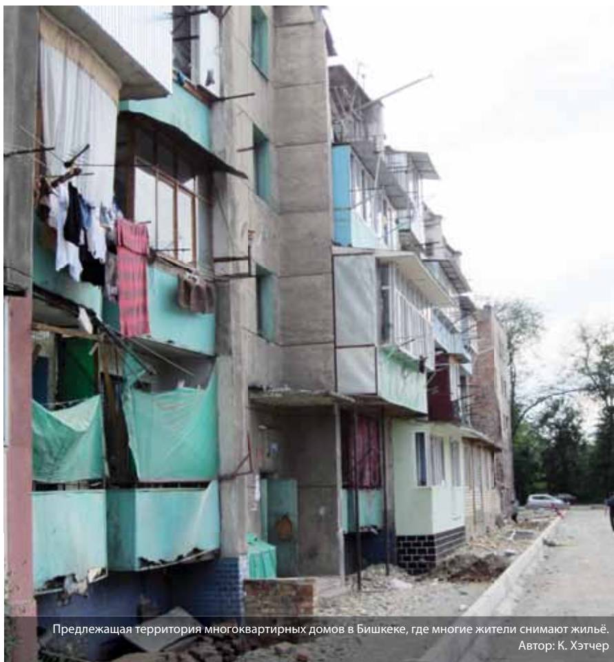
Предлежащая территория многоквартирных домов в Бишкеке, где многие жители снимают жилье.

Существующая паспортно-регистрационная система требует многочисленных документов, несогласованных на национальном уровне, в связи с отсутствием системы базы данных. Это, в свою очередь, может создать проблемы неточ-