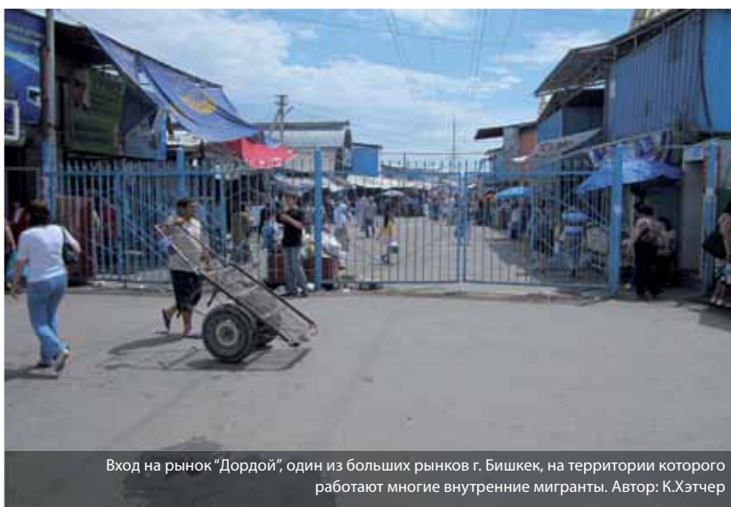
Вход на рынок «Дордой», один из больших рынков г. Бишкек, на территории которого работают многие внутренние мигранты.

Государственная регистрационная служба (ГРС) при Правительстве Кыргызской Республики (государственная организация, ответственная за реализацию паспортно-регистрационной системы) должна следовать существующим рекомендациям по внедрению электронного реестра населения (ОБСЕ, 2012). Централизованная электронная система упростит процесс регистрации для внутренних мигрантов, например, устранив необходимость снятия с учета с прежнего места жительства. Электронная система также будет обеспечивать правительство более точными и полезными данными для планирования.