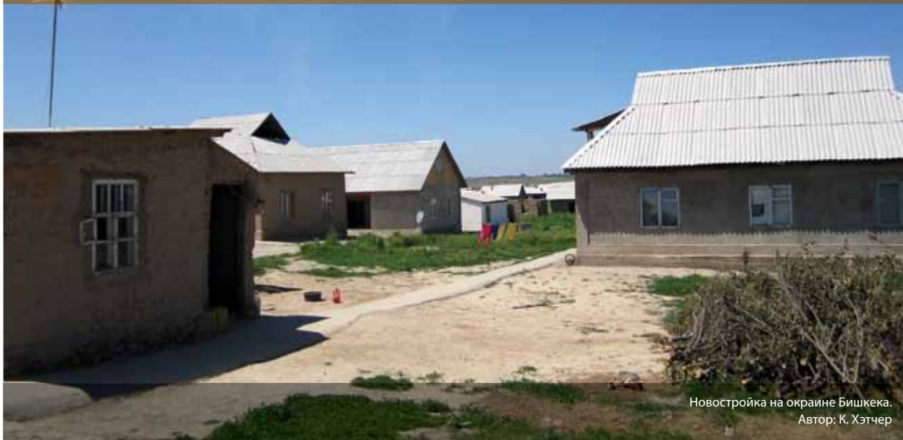
Новостройка на окраине Бишкека.