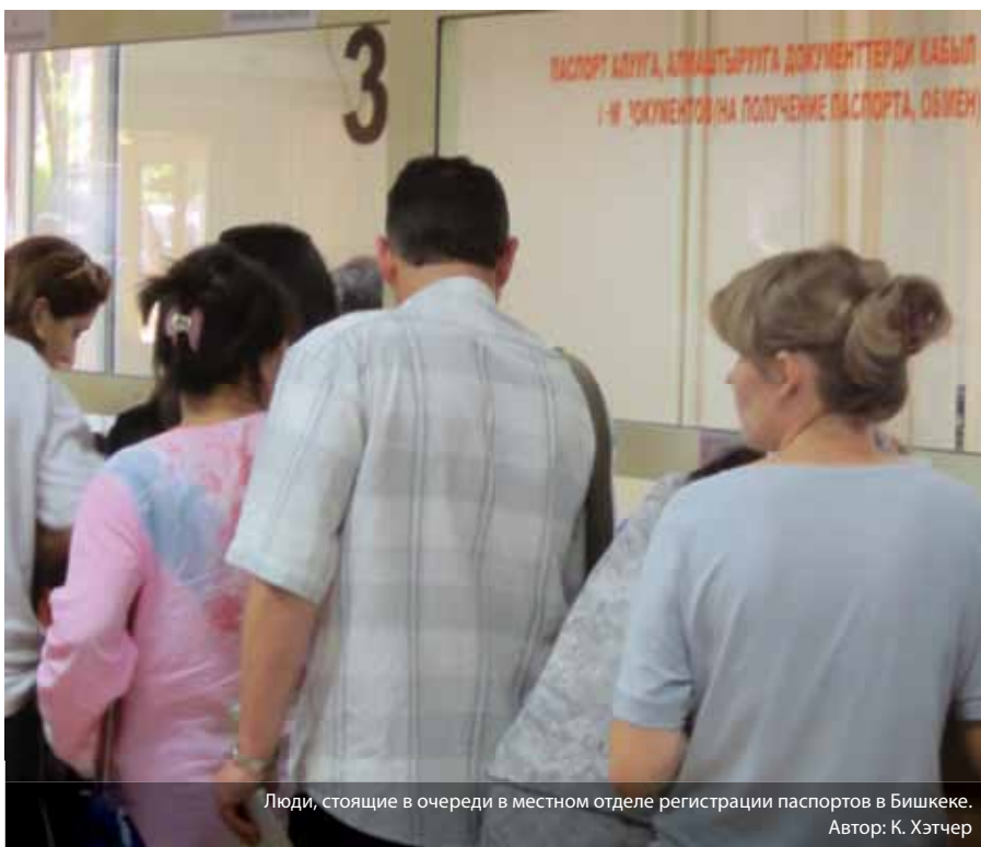
Люди, стоящие в очереди в местном отделе регистрации паспортов в Бишкеке.

Правительству следует рассмотреть вопрос о внутренних мигрантах, которые арендуют и/или живут в одной из незаконных новостроек Бишкека. Те внутренние мигранты, которые арендуют жильё, должны быть зарегистрированы по адресу, где они проживают без необходимости получения разрешения от собственника имущества. Хотя жители незаконных новостроек не имеют официально признанной собственности, в статье 16 п.4 Закона Кыргызской Республики «О внутренней миграции» (2002 г.)