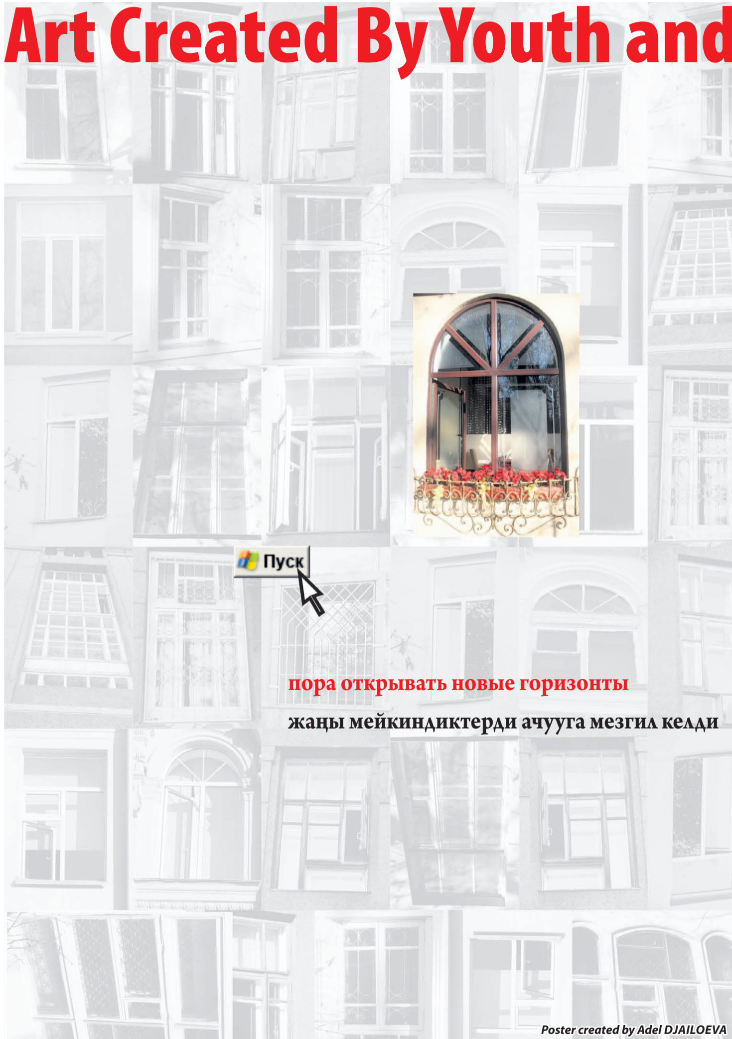
Poster created by Adel DJAILOEVA